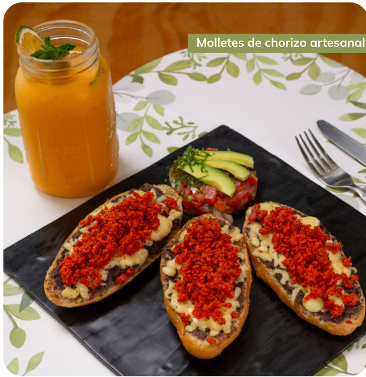
Molletes de chorizo artesanal