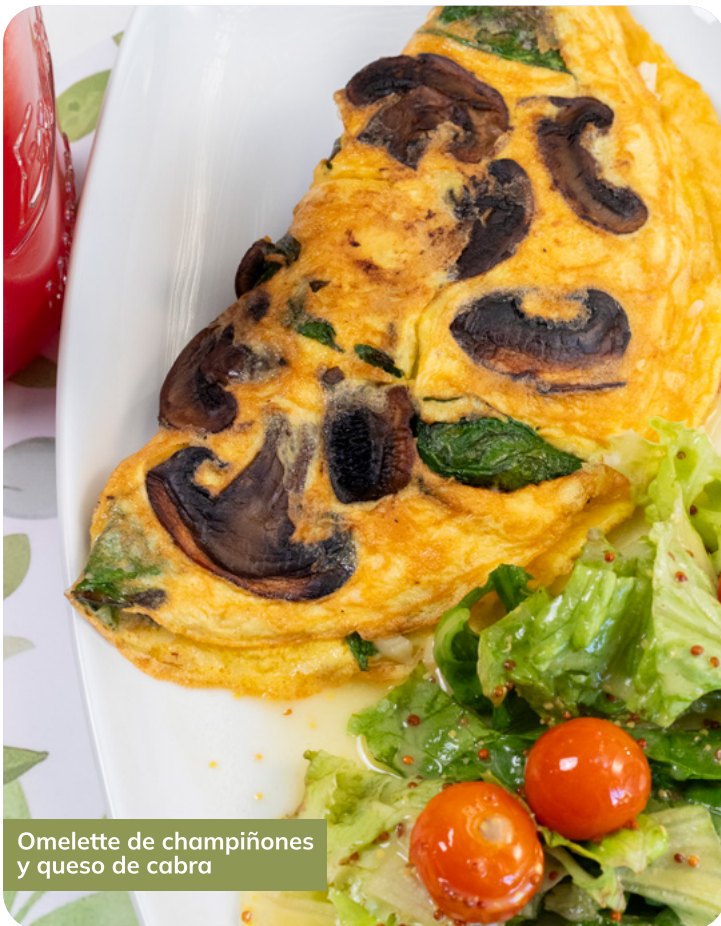
Omelette de champiñones y queso de cabra