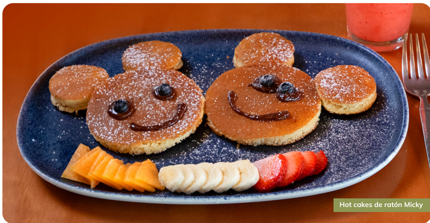
Hot cakes de ratón Micky