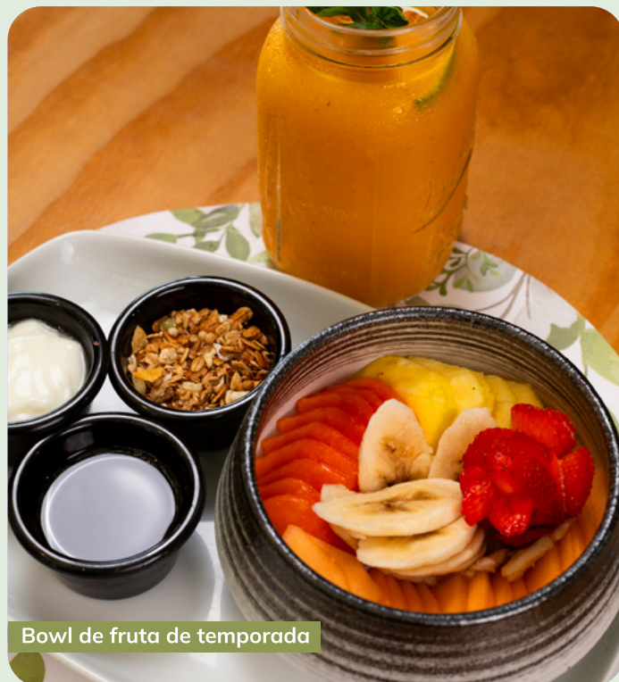
Bowl de fruta de temporada

Elaborado a partir de hojuelas naturales de avena que se cocinan con leche de coco hasta obtener una textura cremosa y suave. Acompañado de plátano tabasco, miel de abeja, fresa y blueberry.