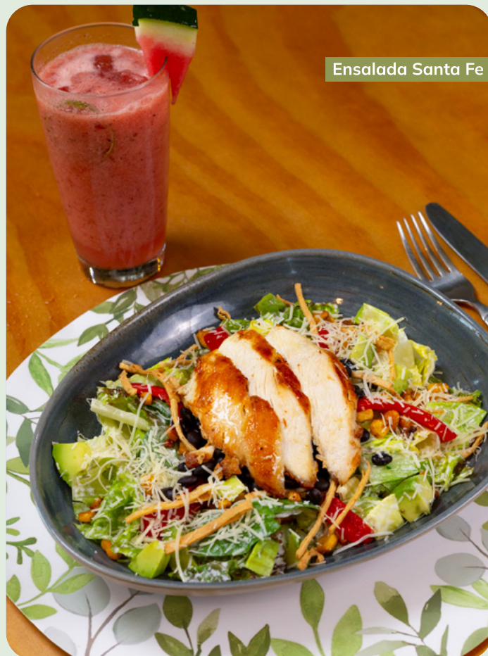
Ensalada Santa Fe