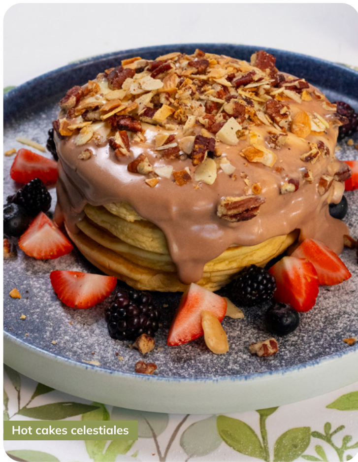
Hot cakes celestiales