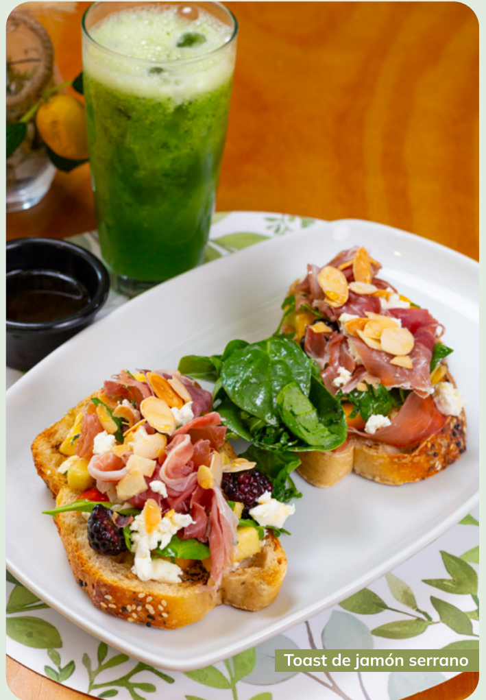
Toast de jamón serrano